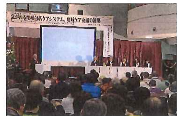
第11回弓浜助け合いネットワーク の様子